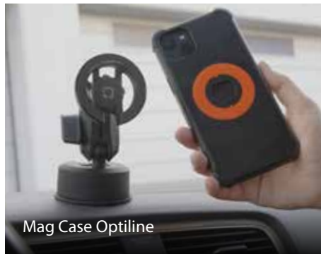
Mag Case Optiline