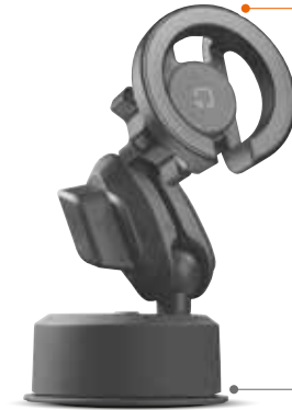
Ventosa adesiva Sticky suction cup

*MagSafe è un marchio registrato di Apple. *MagSafe is registered trademark of Apple.