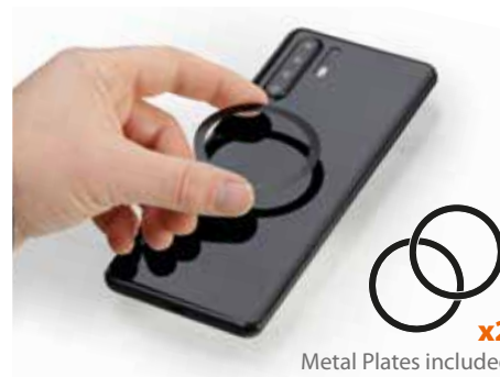
Metal Plates included x2