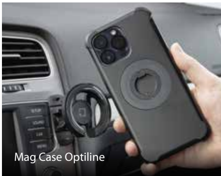
Mag Case Optiline