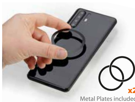
Metal Plates included x2