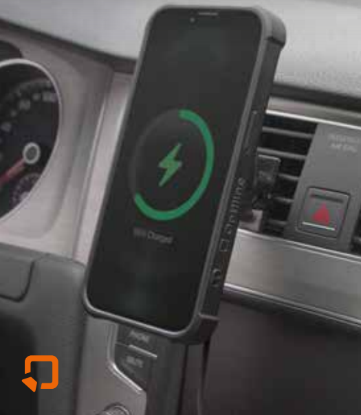
Mag Case Optiline